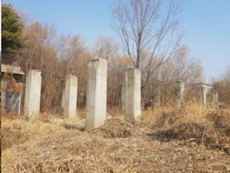
■ 논습지 인접 구간