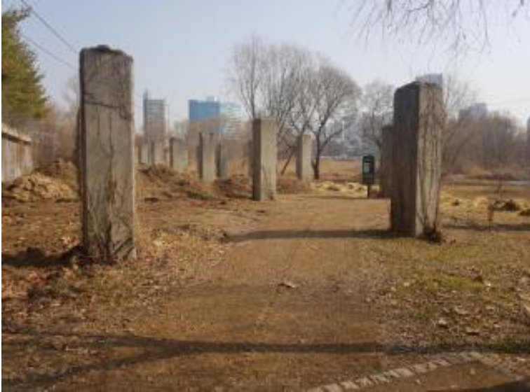
■ 야자메트 설치 구간